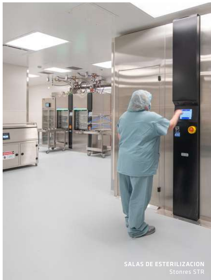
SALAS DE ESTERILIZACION Stonres STR

Los pisos resistentes a productos químicos están diseñados para soportar una amplia gama de productos químicos agresivos durante largos periodos de tiempo. Este tipo de pisos tiene un rendimiento funcional y estético que no se degrada con los derrames químicos repetidos ni con el uso de productos de limpieza industriales. Esto le permite mantener las zonas importantes 100% higiénicas en todo momento sin tener que preocuparse por la longevidad de sus superficies. Están diseñados específicamente para entornos sanitarios con un uso intensivo de productos químicos.