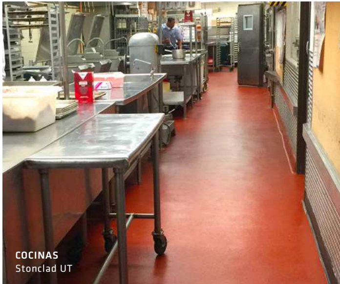
COCINAS Stonclad UT